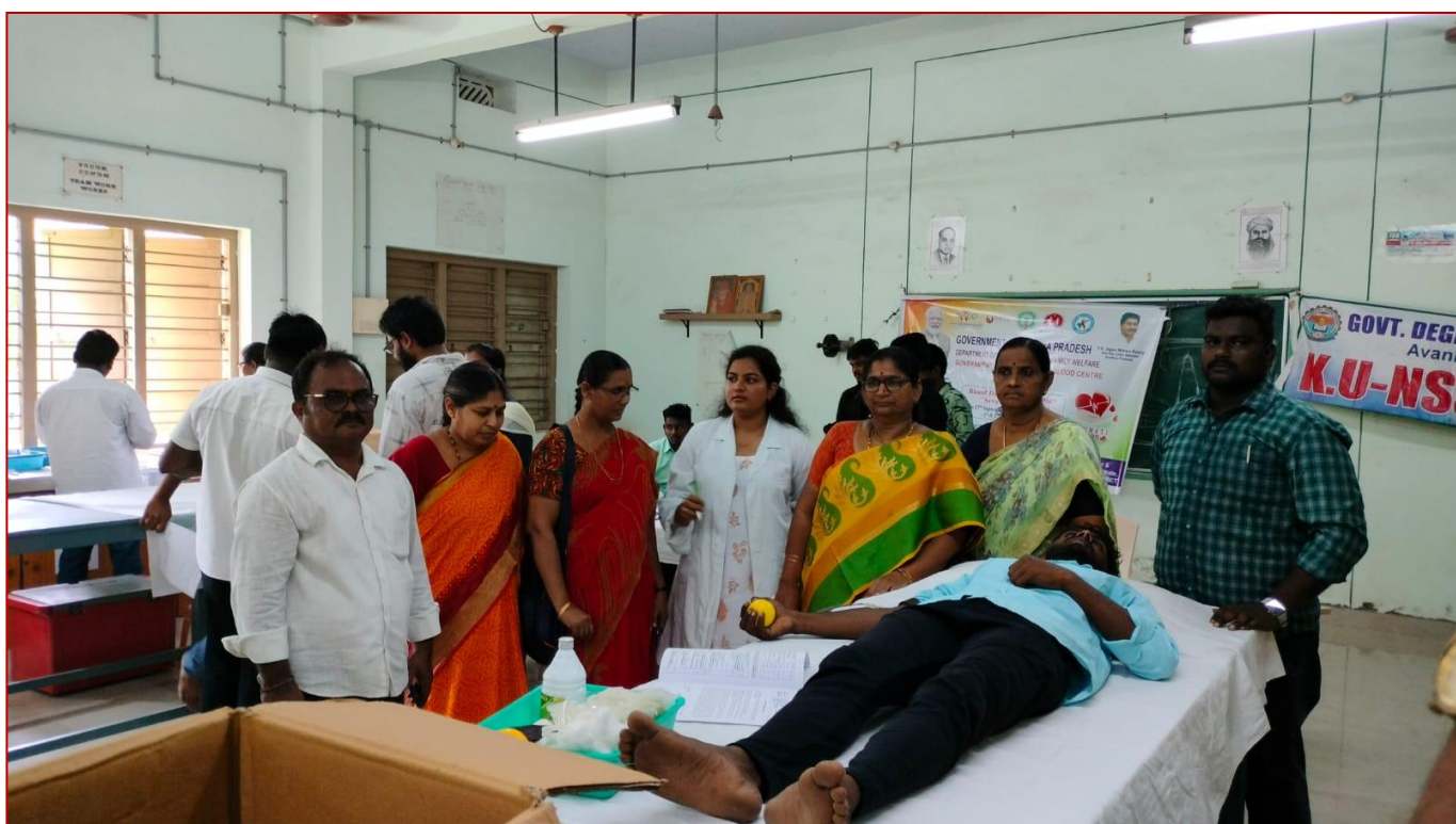
Blood Donation Camp at Physics Lab